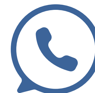
Canal no Whatsapp