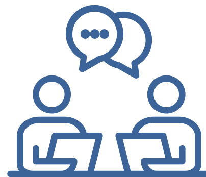
Facilitação de crédito